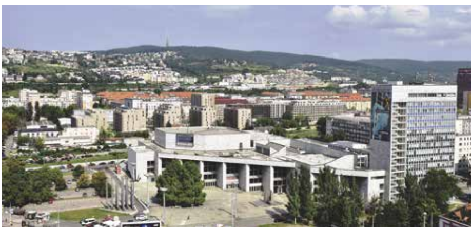
Starý Istropolis nesmie zmiznúť bez náhrady

Vlastník Istropolisu už predstavil svoju víziu, ktorá vyšla z architektonickej súťaže. Nový Istropolis je väčší, podobá sa na ten dnešný a jeho súčasťou je aj obnova verejných priestorov. Tak, aby sa Trnavské mýto stalo ďalším centrom, ktoré bude priťahovať ľudí, miestom stretnutí a priestorom