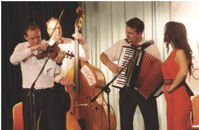
Ku desiatkam gratulantov sa pripojili aj členovia súboru Ludová hudba Hron

Predovšetkým mám radosť, že vďaka nim môžeme propagovať