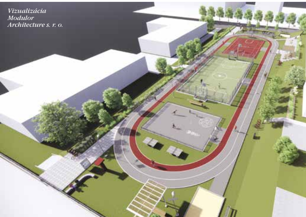
Vizualizácia Modulor Architecture s. r. o.

pečným pružným povrchom z moderných materiálov. Najmladšia generácia tu nájde obľúbené hracie prvky, o čosi starší zocelia svoje telo na workoutových konštrukciách, kým seniori ocenia trénera a iné športové zariadenia prispôbené zrelému veku cvičencov. Na obvodovom športovisku budujeme bežecký ovál, ako aj ovál s tvrdým povrchom určený pre korčuliarov a cyklistov. Chýbať nebude doskočisko, stojany na bicykle, petangové ihrisko a možnosť zahrať si stolný tenis. Rodičov dohliadajúcich na najmladších atlétoch, ako aj fanúšikov sledujúcich miestne turnaje potešia zrekonštruované tribúny čiastočne zastrešené pergolami. Osvetlenie ihriska zabezpečíme solárnymi lampami.