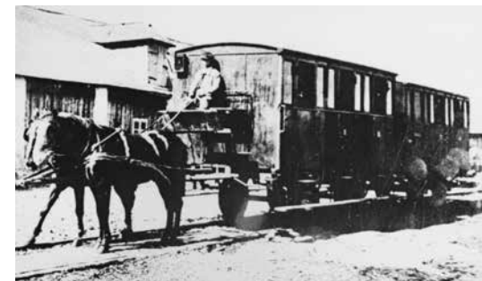
Osobné vlaky mali po dva vozne

Pôvodne bolo v pláne, že železnica povedie aj cez Modru. Avšak modranské mestské zastupiteľstvo na svojom sneme v roku 1838 odmietlo povoliť stavbu železnice na modranských pozemkoch