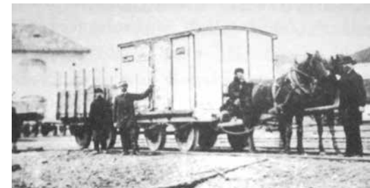
Nákladné vlaky konskej železnice mali dva až päť vozňov, podľa hmotnosti a objemu práve prepravovaného nákladu

s takýmto odôvodnením: „Železnica je novodobý vynález rozsievajúci nemorálnosť a hriech...“ V roku 1839 si to mestskí páni rozmysleli, dokonca ponúkli 60 000 zlatých aj pozemky na výstavbu železnice, ale bolo už neskoro. Plány na výstavbu