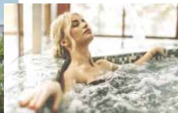
SPA SOĽNÁ JASKYŇA