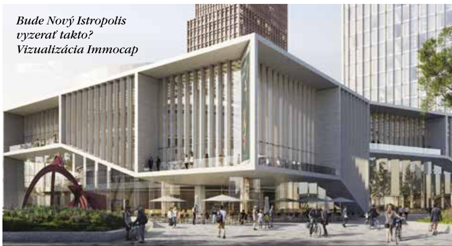
Bude Nový Istropolis vyzerat takto? Vizualizácia Immacap