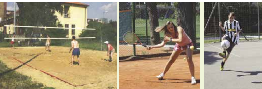
ŠKOLAK klub si počas desiatok rokov rovnako obľúbili malí aj veľkí športovci.

Kým fungovanie nepreerušila pandémia covidu, Školak klub každoročne organizoval alebo spolupracoval na príprave približne desiatky rôznych turnajov a podujatí.