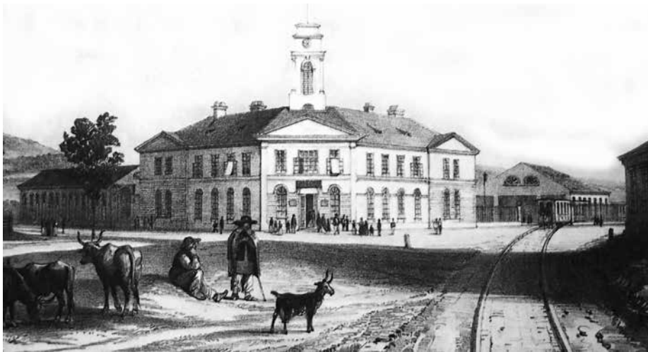
Výpravná budova konskej železnice v roku 1840, autor stál na dnešnej Karadžičovej ulici

Na rohu dnešnej Krížnej a Legionárskej ulice sa nachádza historický unikát európskeho významu – výpravná budova konskej železnice, prvej vo vtedajšom Uhorsku. Postavila a do prevádzky ju postupne dávala súkromná Bratislavsko-Trnavská železničná spoločnosť. Povolenie na stavbu bolo vydané v roku 1838. Už 4. októbra 1840 bola otvorená verejná prevádzka na prvom úseku, teda z Bratislavy do Sv. Jura. Celú železnicu do Trnavy s neskorším predĺžením do Serede odovzdali do verejného užívania 11. decembra 1846.