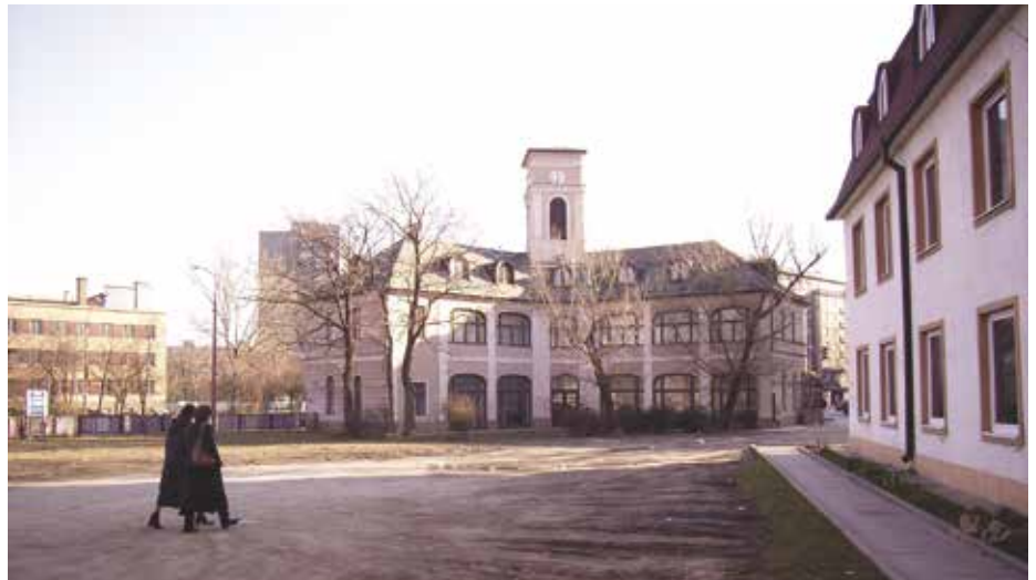
Pohľad na výpravnú budovu z bývalého koľajiska

V roku začiatku prevádzky kónskej železnice sa ešte nejazdilo v noci, vo vagonoch nebol ani záchod, prípadnú telesnú potrebu si cestujúci museli vybaviť pri po byte v staniách, kde sa prepriahali kone.